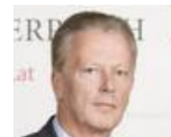
Wirtschaftsminister Reinhold Mitterlehner übernimmt nun auch das Wissenschaftsministerium.