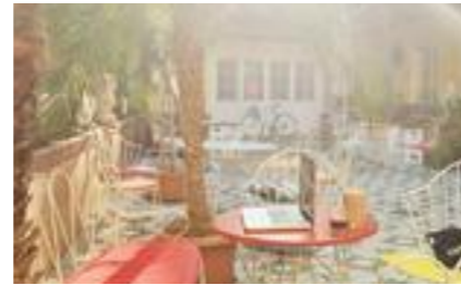
Café am Brillantengrund Bandgasse 4, 1070

Lichterketten hängen in den alten verwunschenen Bäumen, auf jedem der kleinen 50er Jahre Tische ist eine kleine Lampe und die Architektur des Milchhäuschens stammt von Oswald Haerdtl. Den Tag kann man hier ganz wunderbar mit Frühstück, Buch und Kaffee vertrödeln, am Abend spielen Djs zum Barbecue. Dienstag bei Sommerwetter sollte man früh kommen, sonst steht man schon mal stundenlang in der Schlange, um beim »Techno Café« dabei zu sein. Hier treffen Businessmänner auf die Kreativszene und Studenten auf Models.