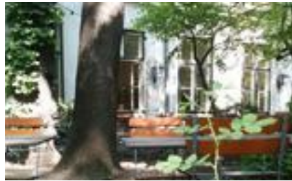
Flein Boltzmanngasse 2, 1090

Die Sonne scheint, der Spritzer kühlt, endlich ist der Sommer da. Und schon wird die Stadt zum Schanigarten erklärt. Wer dem Trubel entgehen mag, wird hier fündig: Schön versteckt und garantiert frei von Touristen.