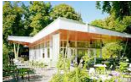
Volksgarten Pavillon Burgring 1, 1010

Hinter einer unscheinbaren Tür in der Mauer des französischen Kulturinstituts, eröffnet sich einer der romantischsten Gärten Wiens. Lichterketten baumeln zwischen alten Bäumen, neben den einfachen Holztischen blühen die Blumen und der Blick auf den Park ist ungebrochen. Auf der täglich wechselnden Speisekarte gibt es vor allem österreichische, aber auch internationale Gerichte zwischen 7 und 19 Euro. Der Innenraum ist angenehm reduziert und wirkt durch die Nähe zum Kulturinstitut beinahe französisch.